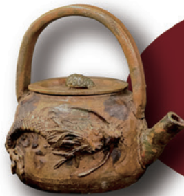
岩谷堂焼 龍紋土瓶