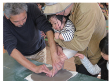
足がた採取の様子