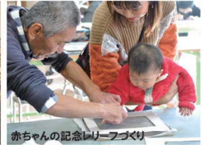
赤ちゃんの記念レリーフづくり