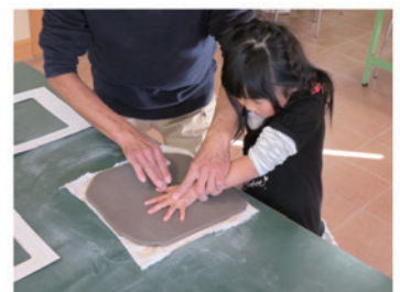
手がた採取の様子