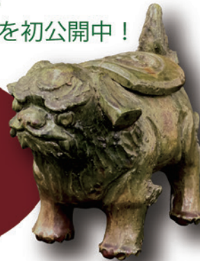
岩谷堂焼 獅子香炉