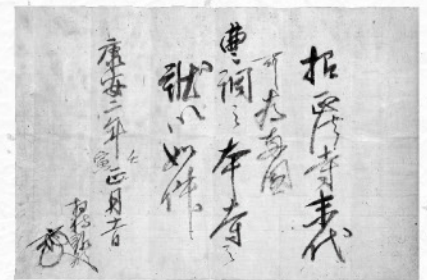
両国曹洞本寺峨山禪師置状 總持寺峨山韶碩狀 慶安2年(1362)