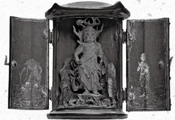
厨子入不動明王立像 南北朝時代

本展では、通常非公開となっている正法寺の寺宝を公開。東北地方における宗教・文化形成に果たした正法寺の大きな役割を通じて、郷土の歴史の一端に触れて頂ければ幸いです。