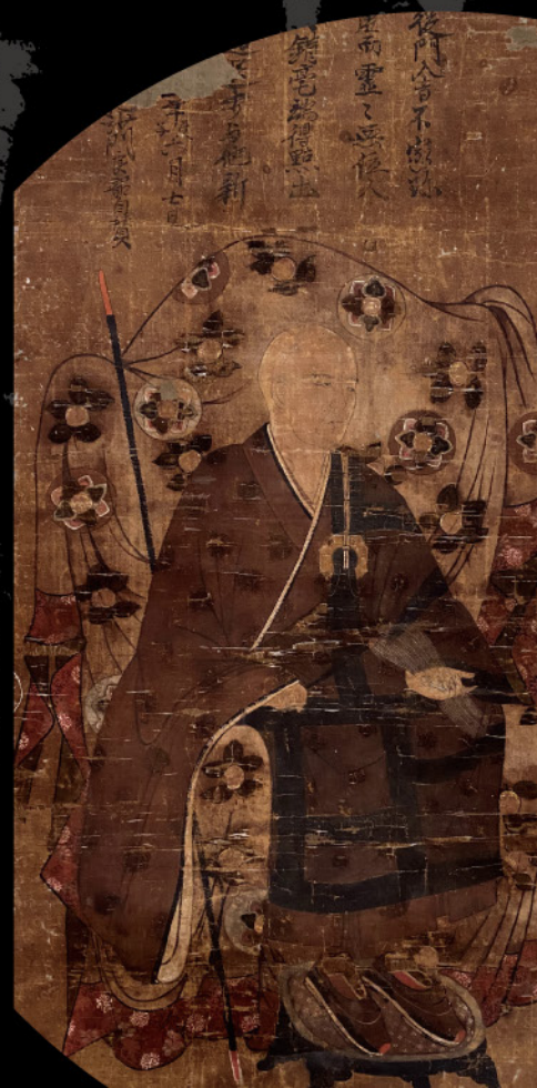
開山無底良詔禪師像 〔延文5年(1360)〕