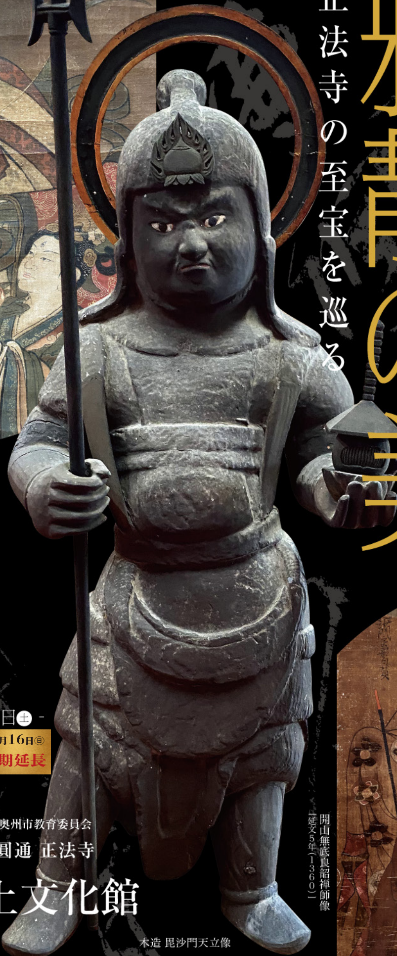
木造 毘沙門天立像