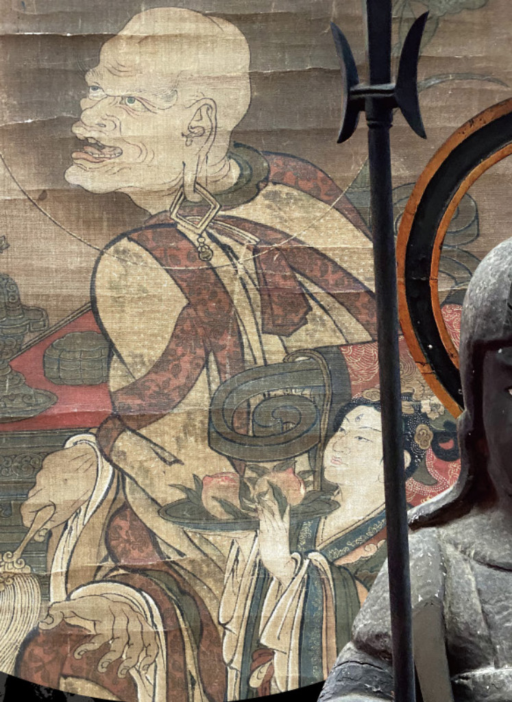
十六羅漢像 戒博伽尊者 [南北朝時代]