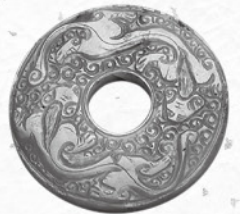
滑石製婆羅 開山遺宝