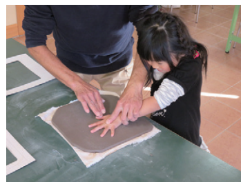
手がた採取の様子