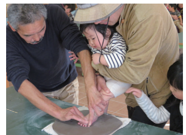
足がた採取の様子